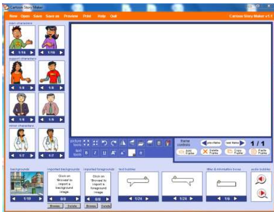
Εικόνα 1: Το περιβάλλον εργασίας του Cartoon Story Maker